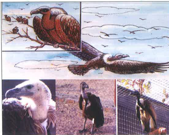
भारत में गिद्ध संरक्षण सुविधाएं

वर्ष के दौरान संरक्षण हेतु प्रजनन पर बनी उप समिति की बैठक 16.7.06 व फिर 29.11.06 को हुई जिसमें विभिन्न प्रस्तावों पर विचार विमर्श हुआ। भारतीय चिड़ियाघरों में व्हाइट बैंक वल्चर, स्लैडर बिल्ड वल्चर, लॉंग बिल्ड वल्चर के संरक्षण हेतु प्रजनन को अन्तिम रूप देने हेतु गिद्ध संरक्षण एवं प्रजनन केन्द्र पिंजौर में एक तीन दिवसीय कार्यशाला का आयोजन किया गया। कार्यशाला का आयोजन भारत के वन्यजीव संस्थान व बाम्बे नैचुरल हिस्ट्री सोसाइटी के सहयोग से किया गया। संबंधित राज्यों के मुख्य वन्यजीव पालक व वन्यजीव संस्थान, बाम्बे नैचुरल हिस्ट्री सोसाइटी, जुलोजिकल सोसाइटी लंदन व आर एस पी.बी यू.के के प्रतिनिधियों के अतिरिक्त जूनागढ़ भोपाल भुवनेश्वर व हैदराबाद के चिड़ियाघर निदेशकों ने कार्यशाला में भाग लिया। यह निर्णय किया गया कि इन स्थानों पर प्रत्येक चिड़ियाघर को प्रजनन केन्द्र स्थापित करने हेतु 41.00 लाख रुपये उपलब्ध कराये जाएंगे। उत्तर पूर्वी क्षेत्रों के संकटापन्न