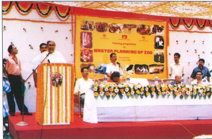
भारत में चिड़ियाघरों के निदेशकों/प्रबन्धकों हेतु चिड़ियाघरों की मास्टर प्लानिंग पर प्रशिक्षण कार्यक्रम

अप्रैल 2006 के दौरान भारतीय वन्य जीव संस्थान, देहरादून के सहयोग से नंदनकानन जैविक उद्यान भुवनेश्वर में चिड़ियाघरों के निदेशकों/प्रभारियों के लिए दो सप्ताह का प्रशिक्षण कार्यक्रम आयोजित किया गया। भारतीय पशु चिकित्सा शोध संस्थान, बरेली के सहयोग से 5 से 11 मार्च 2007 तक चिड़ियाघरों के पशुचिकित्सकों के लिए प्रशिक्षण कार्यक्रम बरेली में आयोजित किया गया। चिड़ियाघरों के मध्य स्तर के कर्मचारियों के लिए अरिगनार अन्ना जैविक उद्यान, चैन्नई में 09 से 18 नवम्बर तक दो सप्ताह का प्रशिक्षण कार्यक्रम आयोजित किया गया। भारतीय वन्य जीव संस्थान ने कार्यक्रम का समन्वय किया। क्षेत्रीय स्तर पर क्षेत्रीय भाषाओं