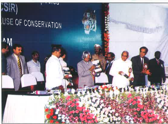
महामहिम राष्ट्रपति डॉ. ए.पी.जे अब्दुल कलाम द्वारा लैकोन्स का उदघाटन

शोध पर उपसमिति की बैठक 05-07-2006 को हुई। अनुशांसाओं को प्राधिकरण की 21.7.06 को हुई बैठक में रखा गया। सेन्टर फार सेल्यूलर एन्ड मालिक्यूलर बायोलॉजी/लैकोन्स के साथ व भारतीय चिड़ियाघरों ने संकटापन्न प्रजातियों के संरक्षण में बायोतकनीकी हस्तक्षेप पर पाँच वर्ष लम्बी एक शोध परियोजना हेतु एम ओ यू पर हस्ताक्षर किये गये। इस अवधि के दौरान लैकोन्स भारतीय चिड़ियाघरों में रखे जंगली जानवरों के वांछित प्रजातियों के आनुवांशिक स्वास्थ्य का विश्लेषण हिमशीतित चिड़ियाघर की स्थापना व उन संकटापन्न प्रजातियों जिनको बंदी रखने की दशा में प्रजनन में समस्या होती है, कि सहायता द्वारा पुनरुत्पादन के क्षेत्र में तकनीकी विशेषज्ञता का विकास